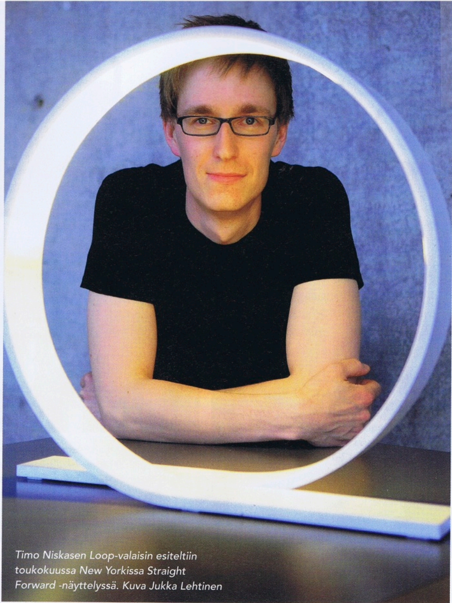
Timo Niskasen Loop-valaisin esiteltiin toukokuussa New Yorkissa Straight Forward -näyttelyssä.