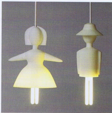
^ Gimmelegs-valaisin, tiedustelut Brands Scandinavia, www.brandsscandinavia.com .

Parasta työssäni ovat hetket, kun saan loistavan oivalluksen pitkään vaivanneeseen ongelmaan. Kurjinta taas on huomata, että joku on jo tehnyt saman oivalluksen jo vuosia aiemmin. (IK) Lisää tietoa osoitteessa www.timoniskanen.fi